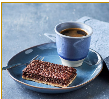
Cacaosnitte Varenr. 300528 Kolli/vægt: 27 x 85 g