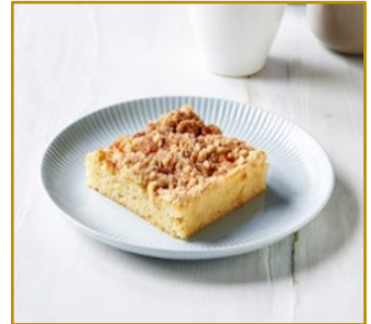
Æblekage Varenr. 300106 2 stk. pr. kolli af 1500 g