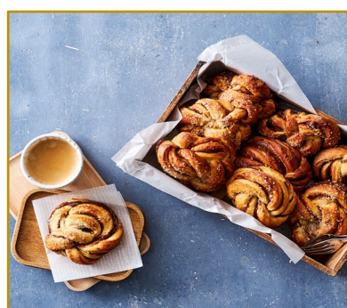
Kannelsnurre Varenr. 300502 30 stk. pr. kolli af 105 g