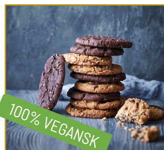
Cookies 100% vegansk Lys varenr. 300228 Mørk varenr. 300229 18 stk. pr. kolli af 90 g