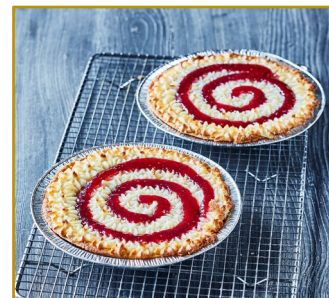
Rådhustærte med hindbærfyld Varenr. 303043 12 stk. pr. kolli af 515 g