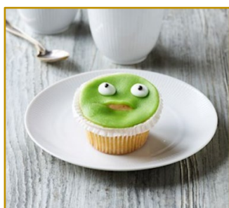
Kaj kage Varenr. 300960 14 stk. pr. kolli af 60 g