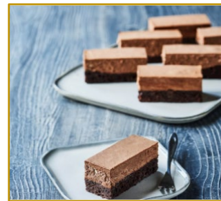
Mørk chokolademousse Varenr. 300775 60 stk. pr. kolli Vægt 70 g pr. stk.