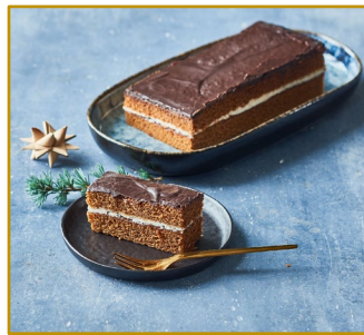
Skøn og saftig Sirupskage Varenr. 306145 Stk. pr. kolli 12 x 320 g