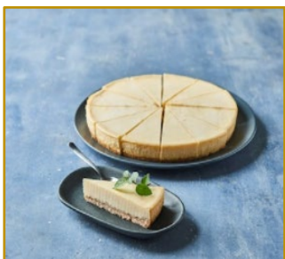
Cheesecake New York Style, udkåret 12 stk. Varenr. 300262 1 stk. pr. kolli/1400 g