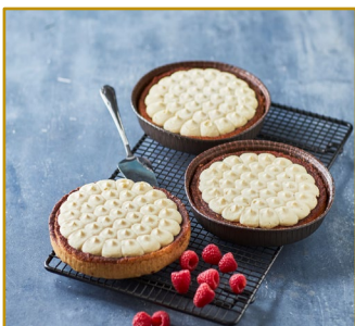
Mazarinbund med creme Varenr. 306112 - Ø16 cm 12stk. pr. kolli af 460 g Pynt selv med fx jordbær, hindbær, brombær eller andet af årstidens bær.