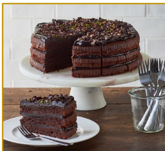
Amerikansk Chokoladetærte Varenr. 304511 1 stk. pr. kolli, 2250 g