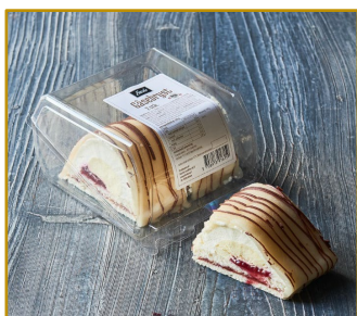
Gåsebryst 2 stk. Varenr. 301615 12 æsker. pr. kolli Vægt 2 stk. 200 g