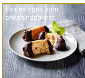
Nøddehorn Varenr. 300749 24 stk. pr. kolli af 50 g