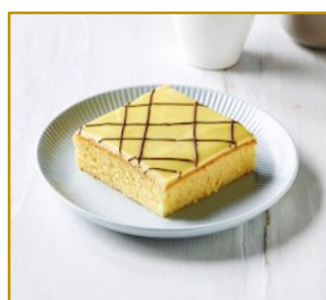
Appelsinkage Varenr. 300100 2 stk. pr. kolli af 1500 g