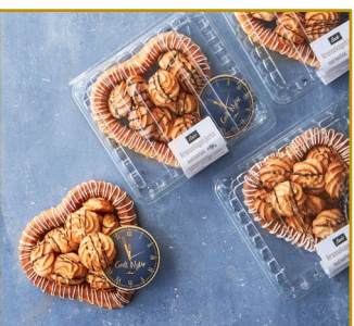
Kransekagehjerter med konfekt, pakket i æske med urskive. Varenr. 300129 Stk. pr. kolli 12 x 300 g