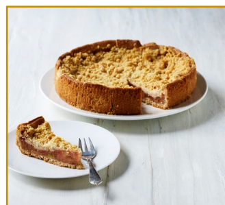
Bedstemor Rabarbertærte, udskåret i 14 stk. Varenr. 301826 1 stk. pr. kolli, 1420 g