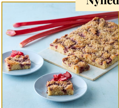
Rabarberkage Varenr. 300239 2 stk. pr. kolli af 1500 g