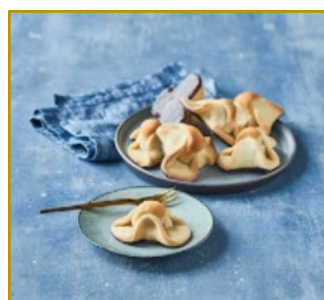
Napoleonshat Varenr. 300752 18 stk. pr. kolli af 55 g