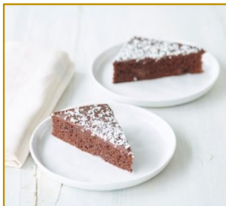
Chokoladecake Udskåret 2 x 36 stk. Varenr. 300133 2 x 1350 g/37,5 g pr. stk.