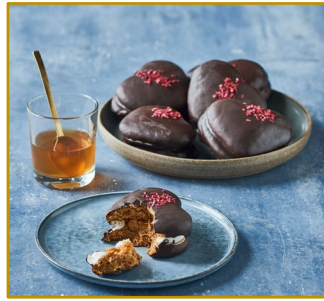
Honningkagebombe med creme og abrikosmarmelade Varenr. 302306, Stk. pr. kolli 24 x 85 g