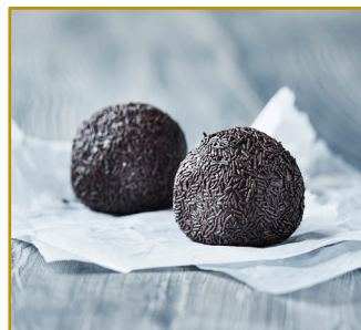
Romkugle med kakaokrymmel Varenr. 306075 40 stk. pr. kolli af 65 g