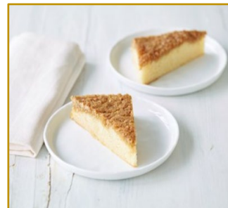
Drømmekage Udskåret 2 x 36 stk. Varenr. 300134 2 x 1350 g/37,5 g pr. stk.