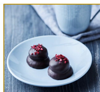
Sarah Bernhard mini Varenr. 300953 50 stk. pr. kolli af 19 g