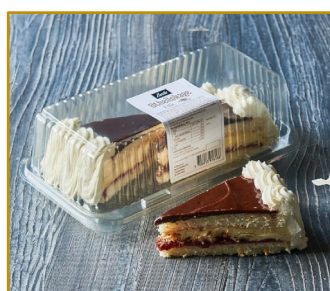
Othellokage 2 stk. Varenr. 301616 6 æsker. pr. kolli Vægt 2 stk. 185 g