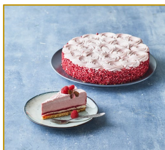
Hindbærlagkage, hel Varenr. 300797 1 stk. pr. kolli Vægt 1600 g