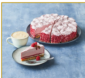
Hindbærlagkage, udskåret i 14 stk. Varenr. 301797 1 stk. pr. kolli Vægt 1600 g