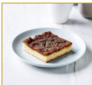
Brunsviger Varenr. 300109 2 stk. pr. kolli af 1500 g