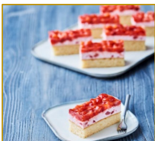
Jordbærmousse Varenr. 300776 60 stk. pr. kolli Vægt 80 g pr. stk.