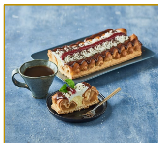
Walesstang Varenr. 300096 6 stk. pr. kolli Vægt pr. stk. 450 g