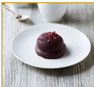
Sarah Bernhard Varenr. 300954 18 stk. pr. kolli af 50 g