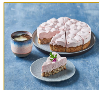
Christianshavnertærte udskåret i 10 stk. Varenr. 301782 1 stk. pr. kolli/830 g