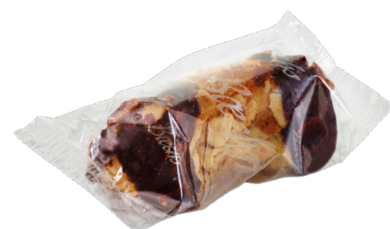
Nøddehorn Varenr. 300981 28 stk. pr. kolli Vægt pr. stk. 50 g