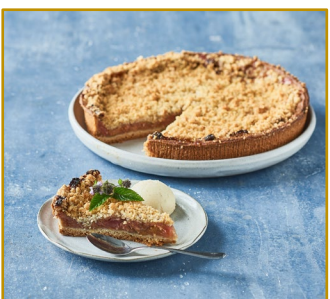
Bedstemor Rabarbertærte, hel tærte Varenr. 300826 1 stk. pr. kolli, 1420 g