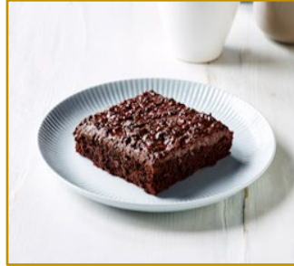
Guf Guf kage Varenr. 300104 2 stk. pr. kolli af 1500 g