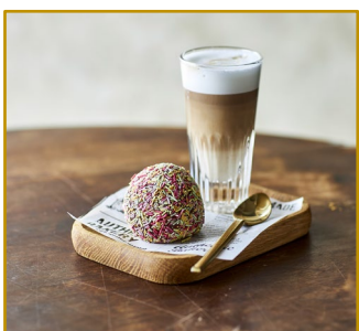
Romkugle kæmpe med farvet krymmel Varenr. 306078 15 stk. pr. kolli af 130 g