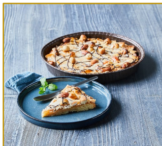
Toscatærte Varenr. 300211 18 stk. pr. kolli af 340 g