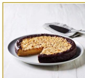
Hasselnøddetærte, hel eller udskåret i 12 stk. Varenr. 300778 & 301778 1 stk. pr. kolli, 1200 g