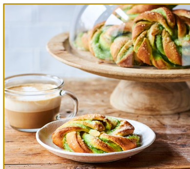
Snurre med pistaciesmag Varenr. 300494 30 stk. pr. kolli af 105 g