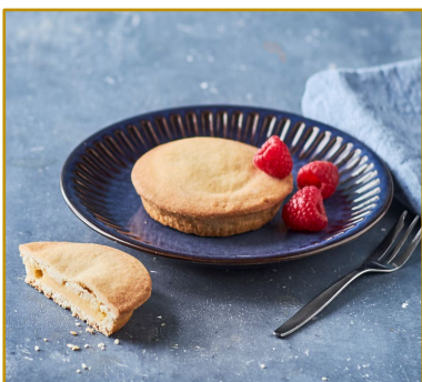
Cremelinse Varenr. 300770 Kolli/vægt: 16 x 85 g