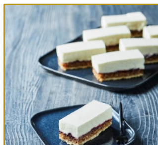
Hvid chokolademousse Varenr. 300777 60 stk. pr. kolli Vægt 80 g pr. stk.