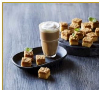
Drømmekage Udskåret 2 x 96 stk. Varenr. 300221 2 x 1350 g/14 g pr. stk.