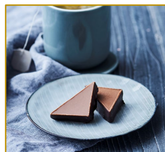
Nougattrekanter mini Varenr. 300177 80 stk. pr. kolli af 17 g