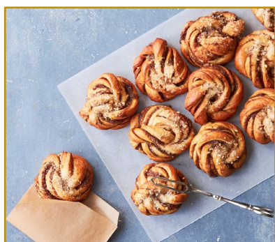
Kannelsnurre mini 50 g Varenr. 300489 50 stk. pr. kolli af 50 g