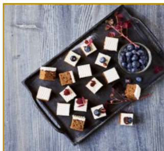
Gulerodskage Udskåret 2 x 96 stk. Varenr. 300222 2 x 1350 g/14 g pr. stk.