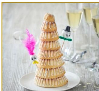
Kransekagetop 7-ringe, færdigpyntet Varenr. 302117 Stk. pr. kolli 8 x 380 g