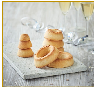
Kransekagetop 7-ringe, usamlet Varenr. 306059 Stk. pr. kolli 12 x 365 g