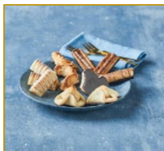
Petit Four kransekage Varenr. 300974 80 stk. pr. kolli af 20 g