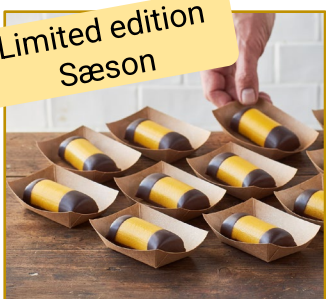
Træstamme gul Varenr. 300975 40 stk. pr. kolli af 80 g