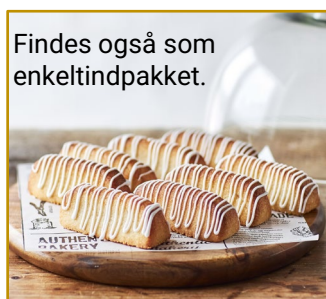
Kransekagestykker Varenr. 300750 40 stk. pr. kolli af 50 g