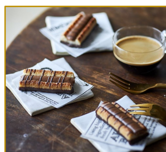
Nougatbjælke mini Varenr. 300957 120 stk. pr. kolli af 19 g