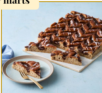
Banan-/kanelkage Varenr. 300264 2 stk. pr. kolli af 1500 g

Altid frisk fra frost – tøj op, skær ud i ønsket størrelse og server til anledningen.