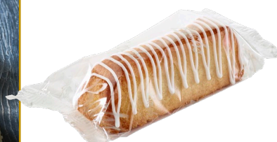
Kransekagestykke Varenr. 300980 32 stk. pr. kolli Vægt pr. stk. 50 g