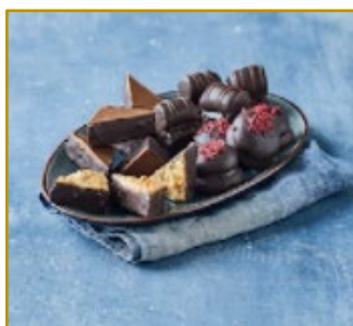
Petit Four, 4 var. Varenr. 300970 80 stk. pr. kolli af 20 g