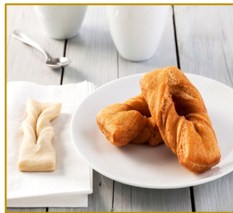
Gammeldags klejner, rå dej Varenr. 306048 Stk. pr. kolli 128 x 50 g