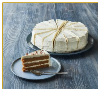
Cheesecake Carrot Udkåret 14 stk. Varenr. 300261 1 stk. pr. kolli/2000 g