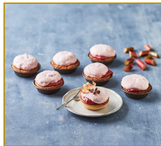
Nødderfryd rabarber Varenr. 300231 15 stk. pr. kaolli Vægt 115 g pr. stk.