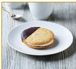
Havregrynskage med creme Varenr. 300045 18 stk. pr. kolli af 70 g