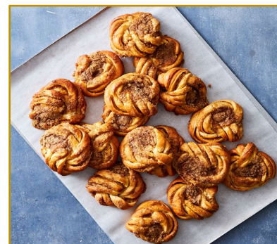
Brunsvigersnurre Varenr. 300495 30 stk. pr. kolli af 105 g