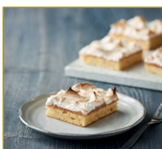
Bedstefars skæg Varenr. 300099 2 stk. pr. kolli af 1550 g