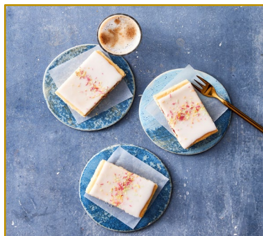
Klassisk hindbærsnitte Varenr. 300521 Kolli/vægt: 32 x 80 g