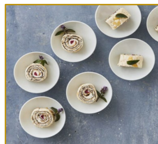
Fragilité roulade Varenr. 300010 5 stk. pr. kolli Vægt pr. stk. 600 g