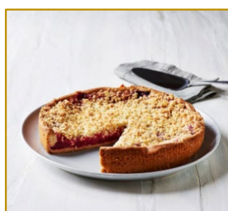
Bedstemor Hindbærtærte Varenr. 300827 1 stk. pr. kolli, 1200 g