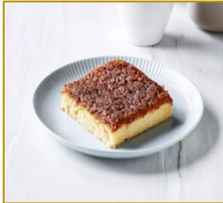
Drømmekage Varenr. 300103 2 stk. pr. kolli af 1500 g