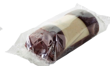
Træstamme Varenr. 300983 32 stk. pr. kolli Vægt pr. stk. 80 g