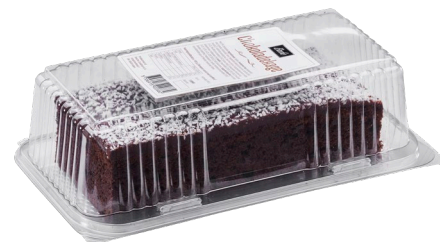
Chokoladecake i blister Varenr. 300088 6 æsker. pr. kolli / vægt 390 g