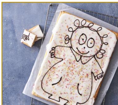
Kagemand Hindbærsnitte uden slik – pynt selv Varenr. 306030, 2 x 1675 g