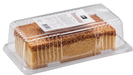
Drømmekage i blister Varenr. 300078 6 æsker. pr. kolli / vægt 380 g