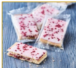
Hindbærssnitte 1 stk. Varenr. 300982 22 stk. pr. kolli Vægt pr. stk. 72 g