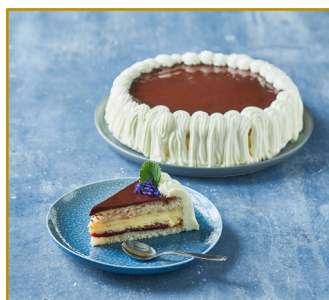
Othello-lagkage, hel Varenr. 300784 1 stk. pr. kolli Vægt 960 g