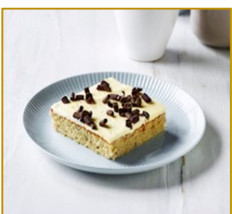
Banankage Varenr. 300101 2 stk. pr. kolli af 1500 g