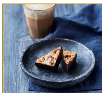
Nøddetrekanter mini Varenr. 300176 80 stk. pr. kolli af 20 g