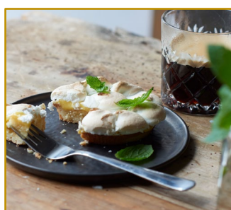
Lemon Marengs Varenr. 300196 15 stk. pr. kolli af 78 g