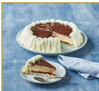
Othello-lagkage, udskåret i 10 stk. Varenr. 301784 1 stk. pr. kolli Vægt 960 g