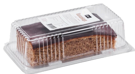
Banankage i blister Varenr. 300079 6 æsker. pr. kolli / vægt 390 g