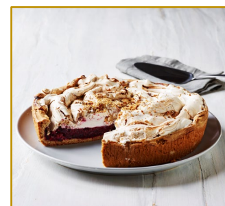
Bedstemor Skovbærtærte Varenr. 300828 1 stk. pr. kolli, 1200 g