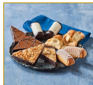
Kagesortiment, lille 5x5 stk. Varenr. 300994 25 stk. pr. kolli af 66 g