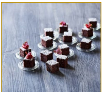
Chokoladecake Udskåret 2 x 96 stk. Varenr. 300220 2 x 1350 g/14 g pr. stk.