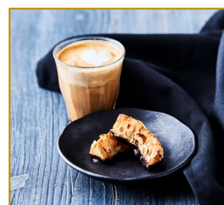
Nøddehorn mini Varenr. 300952 70 stk. pr. kolli af 19 g