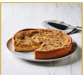
Bedstemor Pæretærte Varenr. 300822 1 stk. pr. kolli, 1150 g