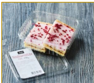
Hindbærssnitte 2 stk. Varenr. 301610 18 æsker pr. kolli Vægt 2 x 72 g pr. stk.