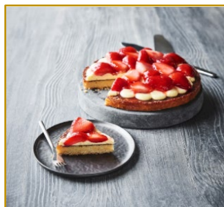
Jordbærtærte Varenr. 300764 1 stk. pr. kolli, 1030 g