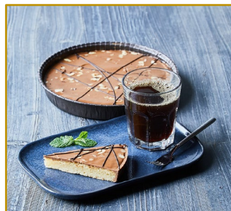
Nougattærte Varenr. 300212 18 stk. pr. kolli af 340 g