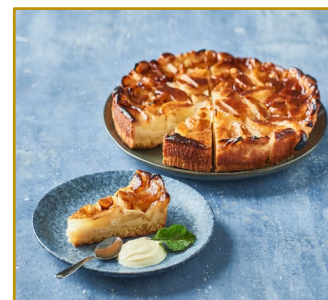
Æbletærte udskåret i 12 stk. Varenr. 301790 1 stk. pr. kolli, 1400 g