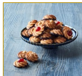
Kransekagekonfekt Varenr. 300751 1800 g pr. kolli Ca. 14 g pr. stk.