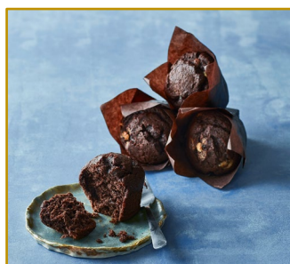
Muffins tripple chocolate Varenr. 301808 24 stk. pr. kolli af 110 g