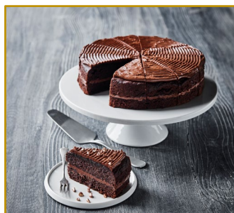
Chokoladetærte udskåret i 12 stk. Varenr. 301807 1 stk. pr. kolli, 1075 g