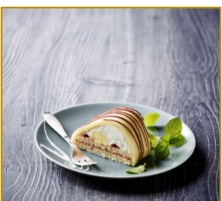
Gåsebryst, stang 28 cm Varenr. 300789 6 stk. pr. kolli Vægt pr. stk. 600 g