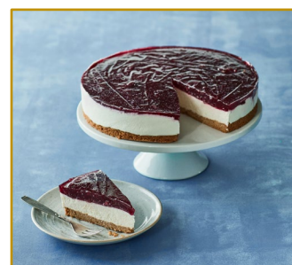
Ostelagkage Varenr. 300860 1 stk. pr. kolli Vægt pr. stk. 1950 g