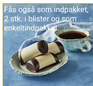
Træstamme Varenr. 300765 40 stk. pr. kolli af 80 g