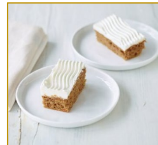
Gulerodskage Udskåret 2 x 35 stk. Varenr. 300136 2 x 1350 g/38,5 g pr. stk.