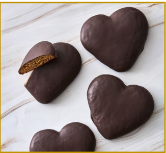
Honningkage hjerte Varenr. 302304 Stk. pr. kolli 48 x 75 g