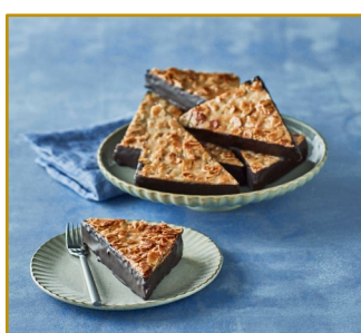
Nøddetrekant Varenr. 300759 24 stk. pr. kolli af 80 g