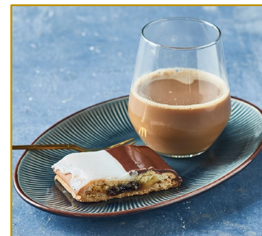
Dag- og natsnitte Varenr. 300524 Kolli/vægt: 27 x 90 g