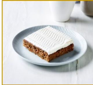
Gulerodskage Varenr. 300105 2 stk. pr. kolli af 1500 g