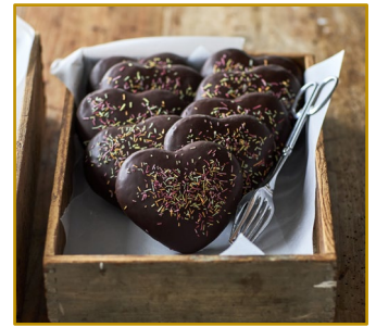
Honningkage hjerte med krymmel Varenr. 306100, Stk. pr. kolli 72 x 33 g