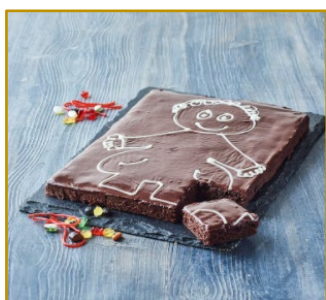
Kagemand Choko uden pynt – pynt selv m. slik. Varenr. 306031 2 stk. pr. kolli af 1740 g

Altid frisk fra frost – tøj op, skær ud i ønsket størrelse og server til anledningen.