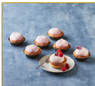
Nødderfryd hindbær Varenr. 300230 15 stk. pr. kolli Vægt 95 g pr. stk.