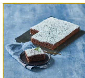
Chokoladecake Varenr. 300102 2 stk. pr. kolli af 1500 g