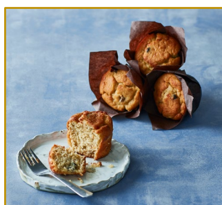
Bananmuffins Varenr. 301809 24 stk. pr. kolli af 110 g