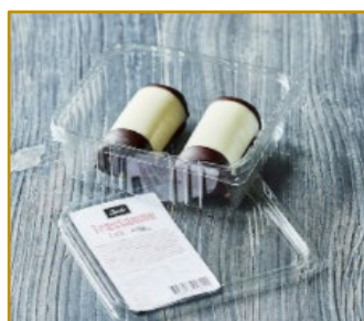
Træstamme 2 stk. Varenr. 301611 18 æsker pr. kolli Vægt 2 x 80 g pr. stk.