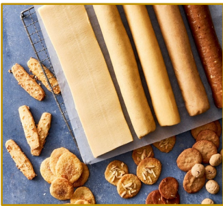
Småkageruller, ubagt Varenr. 306052 Kolli 15 x 500 g 3x5 slags