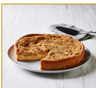
Bedstemor Æbletærte Varenr. 300824 1 stk. pr. kolli, 1450 g