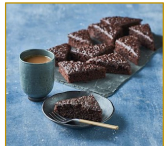
Guf Guf kage Udskåret 2 x 36 stk. Varenr. 300135 2 x 1350 g/37,5 g pr. stk.