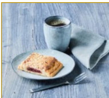
Makronsnitte m. hindbær Varenr. 306027 Kolli/vægt: 27 x 75 g