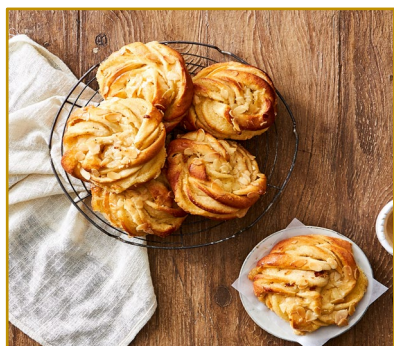
Marcipansnurre Varenr. 300499 30 stk. pr. kolli af 105 g