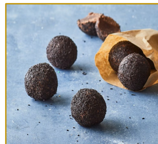
Romkugle kæmpe med kakaokrymmel Varenr. 306077 15 stk. pr. kolli af 130 g