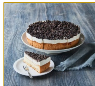
Cheesecake med Oreo crunch, Varenr. 300260 1 stk. pr. kolli Vægt pr. stk. 1700 g