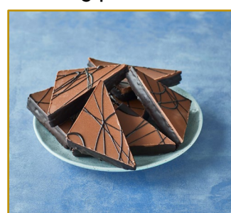
Nougattrekant Varenr. 300966 24 stk. pr. kolli af 65 g